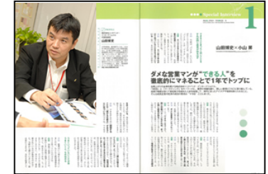
社長様へのインタビュー形式です。

ザメディアジョンに集まってくる学生達に「就職活動で大切にすべきことや中小企業の魅力」を伝えます。紙面では実際に採用活動に力を入れている経営者からの話をメインコンテンツとし、その企業へのエントリー喚起をはじめ、会社説明会や選考を進む過程での更なる魅力付けにつながります。